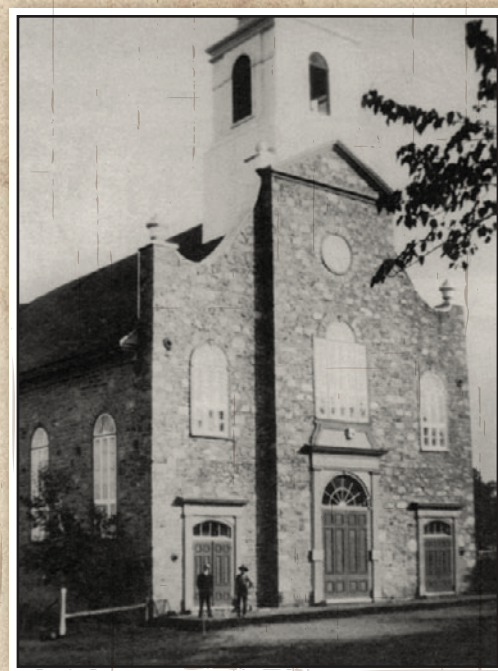
Façade de l'église avant 1925, sans le portique avant